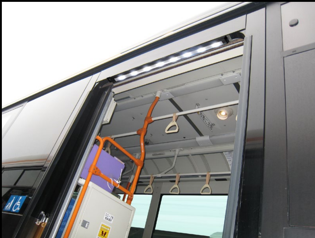
型式SFL-30M-7Sを搭載したイメージ